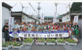
大船渡市内の仮設住宅にて

仮設住宅の入居者のみなさんと一緒に、大船渡市の障害者福祉施設で育てたニチニチソウやサルビアなどのポット苗をプランターに植え替える作業を楽しみながら取り組みました。