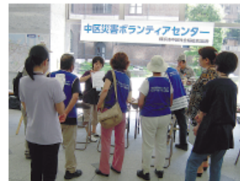
ボランティア希望者へ登録用紙の記入方法を説明

今回は、大地震発生後を想定して、ボランティアの受付から、依頼先へのボランティアの派遣などを中心に行いました。