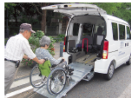
送迎車両が新しくなりました

中区社会福祉協議会では、公共交通機関の利用が困難な高齢者、障害者の外出を支援する送迎サービスを行っています。その送迎車両を運転していただくボランティアを募集しています。詳しい活動内容・活動日等については、下記までお気軽にお問い合わせください。