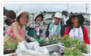
楽しい時間を過ごしました。

8月22日から24日までの3日間、学生から80歳代までのボランティア等37人が、岩手県大船渡市・陸前高田市を訪問し、仮設住宅などでプランターに花の苗を植えて贈る「被災地花いっぱい運動」のボランティア活動を行いました。