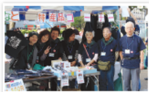
笑顔でお待ちしています!

10・11月の区内で行われるイベントでさんりくの特産品や応援Tシャツ、電車の忘れ物傘などを販売します。販売収益金は“被災地花いっぱい運動”の活動に役立たせていただきます。ぜひお越しください!(横浜高速鉄道様にご協力いただいています)