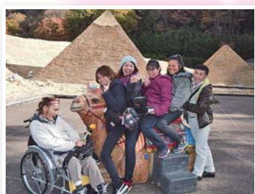
例えば… 障害のある方が企画する福祉事業や社会参加活動に