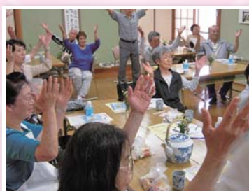
例えば… ひとり暮らし高齢者食事に