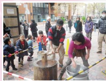
例えば… 地域交流事業に