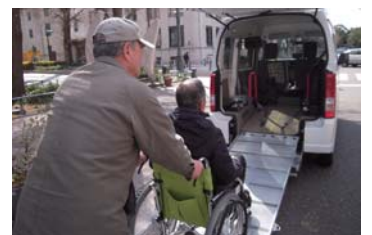
運転時も乗降時も利用者の方の安全を第一に考えています