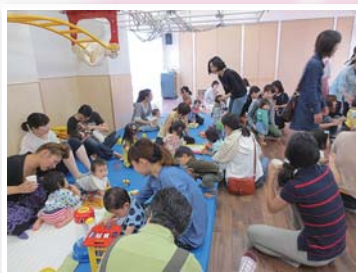
例えば… 地域子育てサロンに

お預かりした金品は、区内の福祉施設・ボランティア・町内会・行政機関の関係者で組織する運営委員会で預託金の内容を確認し配分方法と配分先を決めます。