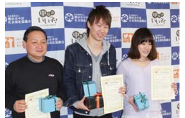
活動者1,000人達成!(平成25年4月)