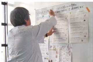
校内の掲示板にはボランティア情報が盛りだくさん