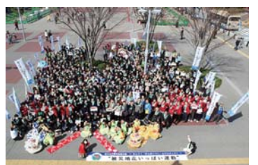
357人が集まって活動した街頭募金活動