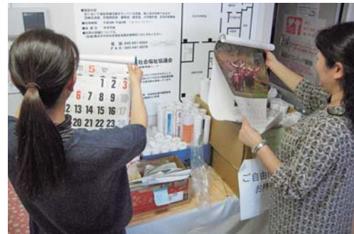
今年もたくさんのご寄付をいただきました 毎年、多くの方々に喜ばれています

私たちの会社のあるビル全体で声をかけ、毎年の恒例行事として集めています。こういった形で他の方のお役に立ててうれしく思います。