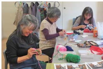
おしゃべりしながら楽しく作業しています

会員の努力はもちろんのこと、バザー会場の提供や材料の寄付など、多くの方々の温かい気持ちに支えられてきました。メンバーの高齢化が進んでいますが、みなさんからの「楽しみにしています」の言葉に生きがいを感じています。これからも新しい仲間を増やし、一針一針に愛をこめて活動を続けていきたいです。