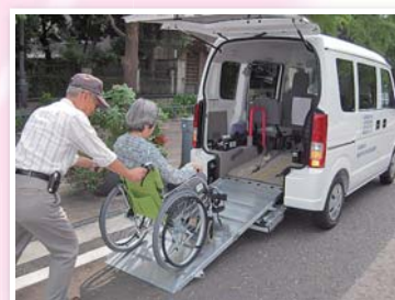
例えば… 高齢者や体の不自由な方々が通院などで外出をする際の送迎サービスに