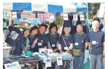
ハローよこはまで、さんりく物産販売を開催

4Dとは… だれもが、 できることを、 できる時に、 できる所で 活動するボランティアの基本原則です