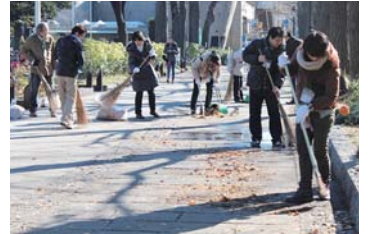
毎週第3土曜日に活動しています

新しい社会貢献活動として、仕事に影響を及ぼさない程度で全員が参加しやすく継続して活動できる活動を探していたところ、この清掃活動に出会いました。最初は義務的な意識もありましたが、ボランティアにかかわる方々とふれあう時間が「心地よい」と感じるようになりましたね。是非、多くの方に参加していただき「心地よさ」を味わってほしいと思います。