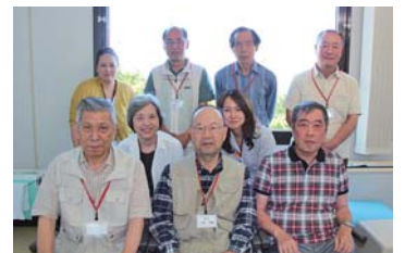
ボランティア仲間と楽しく活動しています!

定年退職後、車の運転で社会貢献をしたいと思い、ホームページで見つけた「葦の会」に入会しました。ボランティアを始めて生活にメリハリがつかましたね。やはり、利用者の方に感謝されると嬉しいです。送迎コーディネーターが双方の予定を勘案してくれるので安心して活動できます。興味のある方、まずは自分の空いた時間に一緒に活動しましょう。