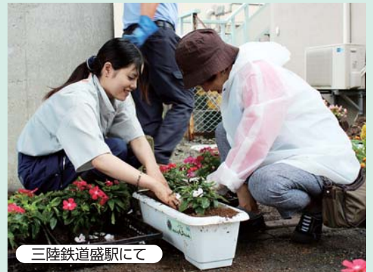
三陸鉄道盛駅にて

参加されたみなさんは被災地の現状を知るとともに、中区での防災対策を見直す機会となった様子でした。