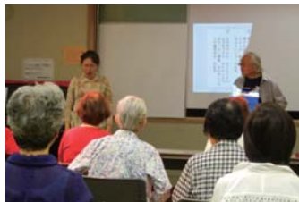
▲ 関内ふれあい健康サロン

住民同士の交流の機会を持ちたいと「関内ふれあい健康サロン」を隔月で開催し、はまちゃん体操、メダカの学校(ピアノ伴奏でうた