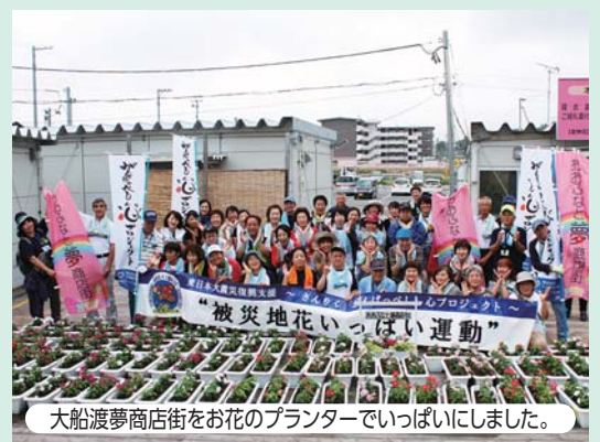
大船渡夢商店街をお花のプランターでいっぱいしました。