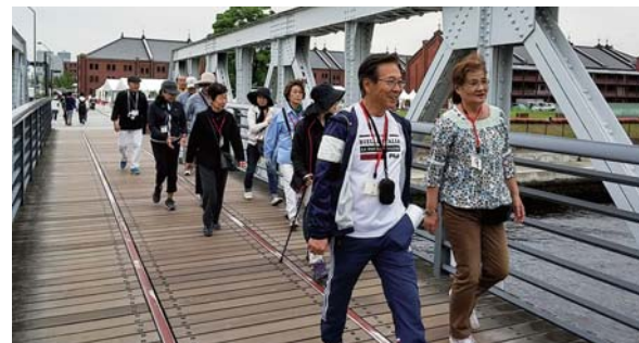
▲ ウォーキングサークル

昨年7月からは、新規開業したホテルが地域住民に提供してくれたロビーで「おしゃべりサロン」も始まりました。赤ちゃん連れのママから年配の方まで、世代の広がりを見せています。赤ちゃんを囲んでとても幸せなひと時です。