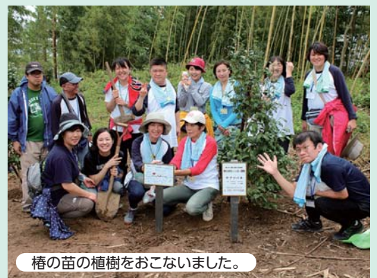
椿の苗木の植樹をおこないました。