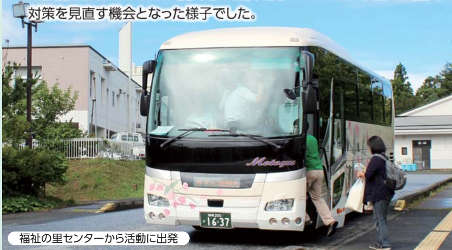
福祉の里センターから活動に出発