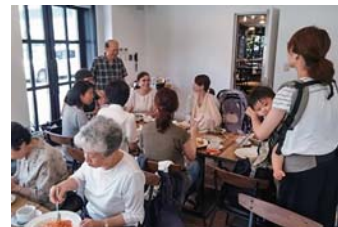
◀ おしゃべりサロン

人と人の“つながり”をもっと増やしたいと「中なかいいネ!馬車道倶楽部」をはじめました。関内地区の歴史等をテーマに講師のお話を聞き、その後レストランで昼食を取りながら歓談します。その歓談の話の中から「歌声サークル」、「ウォーキングサークル」、「街あるきサークル」が誕生し、毎月元気に活動しています。