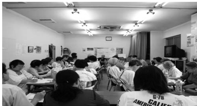
( 会議で懇談する方々の様子 )