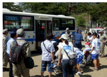
要援護者搬送訓練