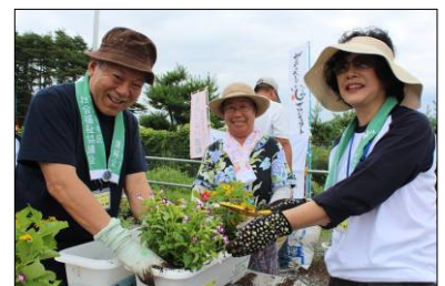
陸前高田市高田町長砂仮設団地にて