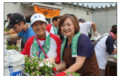
おおふなと夢商店街にて