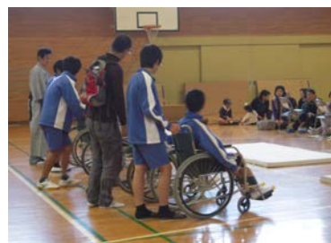
車いす体験（本牧小）