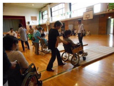
車いす体験（山元小）