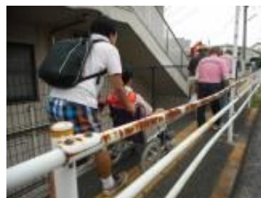
要援護者搬送訓練