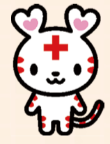
日本赤十字社 神奈川県支部 横浜市地区本部 中区地区