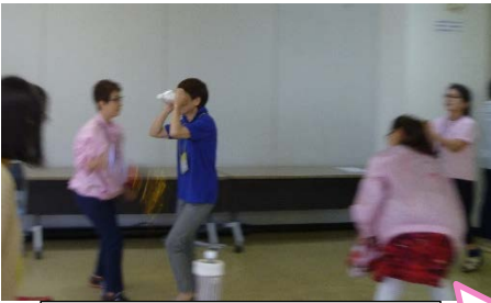
体験プログラム中の様子

中区登録ガイドボランティアの交流会を8月6日に開催しました。講師として障がい児者支援・啓発ネット「わっしょい」の皆さんにも来ていただき、心理体験プログラムで知的障害や発達障害について理解を深めたり、日頃の活動で困っていること等の思いを共有したりし、ガイドボランティアさん同士の交流も深められ充実した時間となりました。