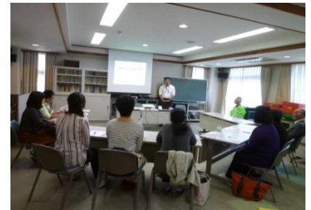
ガイドボランティア講座

支援してほしい時間が早朝であったり、毎日の希望であったりと、登録者と支援希望者の調整が難しいことも多くなっています。そのため、ガイドボランティア講座や障害関連団体への周知活動を行い、ガイドボランティアのすそ野の拡大に取り組んでいます。